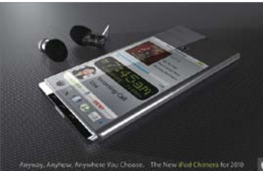
Anyway, Anyhow, Anywhere You Choose... The New iPod Camera for 2010