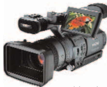
Sony en Apple kunnen het goed met elkaar vinden

Steve zegt, BYODKM: Bring your own display, keyboard & mouse), dus als je alles erbij moet gaan kopen zit je al bijna op de prijs van een iMac. De doelgroep lijkt hier dan ook duidelijk de Dellgebruiker die alleen z'n bakbeest kan vervangen voor een klein mooi designer doosje, waarbij toetsenbord, muis, monitor, printer, modem etc. gewoon kunnen blijven doordraaien. Maar voor een tweede Mac, een mediacom-